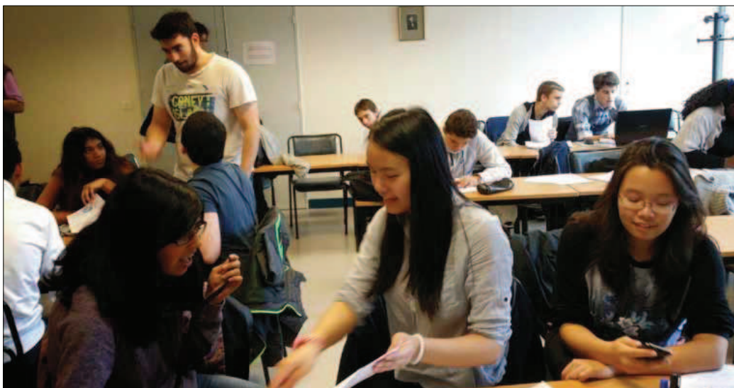
Le pôle de réussite de l'association, lors d'un stage sur le chaos en 2014.