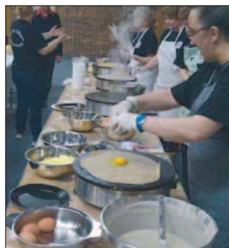
Samedi 11 mars, 300 personnes ont participé à la soirée crêpes de l'association Cercle celtique Douar Breizh.