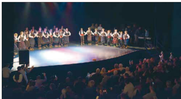
Le spectacle de l'association Perles Biseri a fait le plein, vendredi 10 mars, avec environ 400 personnes.